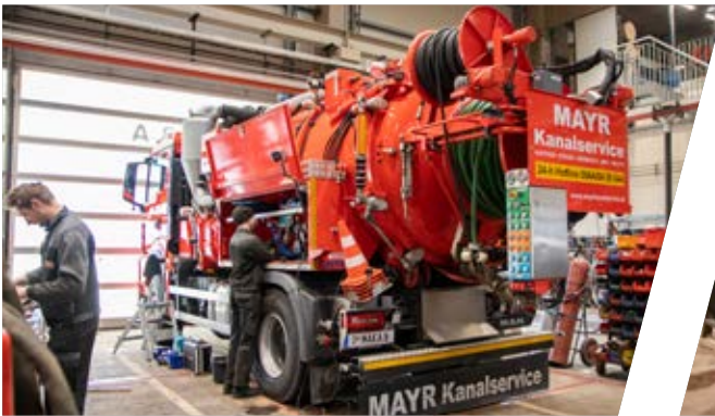
Saugwagen für Kanalreinigung

Sehr gerne können Sie uns Ihre Anfrage für die zukünftige Betreuung zukommen lassen. Wir beraten Sie gerne.