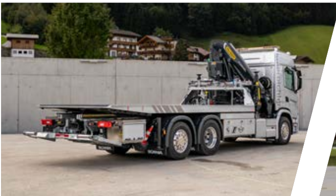
Schiebeplateau mit Kran