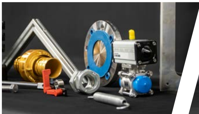
Schnelle & bedarfsgerechte Versorgung mit Ersatzteilen