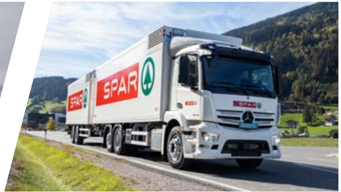
Kühlkoffer mit Anhänger