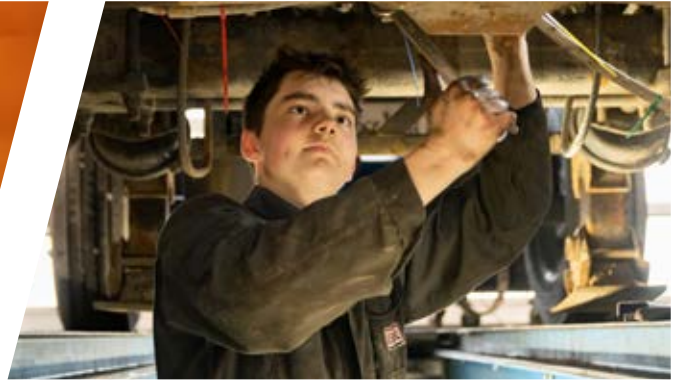
Instandsetzung Luftversorgung am Fahrzeug