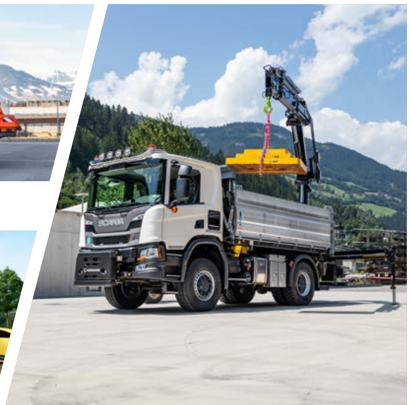
Kipper mit Kran