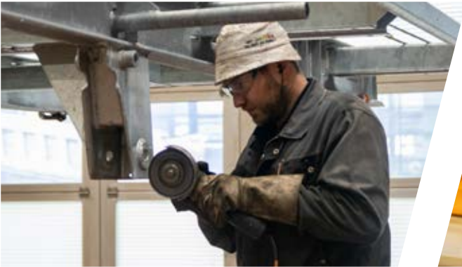
Stahlbauarbeiten gemäß Kundenwunsch