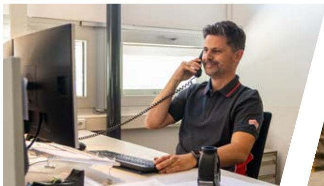
Jahrelange Erfahrung und technisches Know-How

So werden etwaige Stehzeiten auf ein Minimum reduziert und die ständige Einsatzbereitschaft Ihrer Fahrzeuge gewährleistet. Zögern Sie nicht, Kontakt mit unserem Ersatzteilteam aufzunehmen.