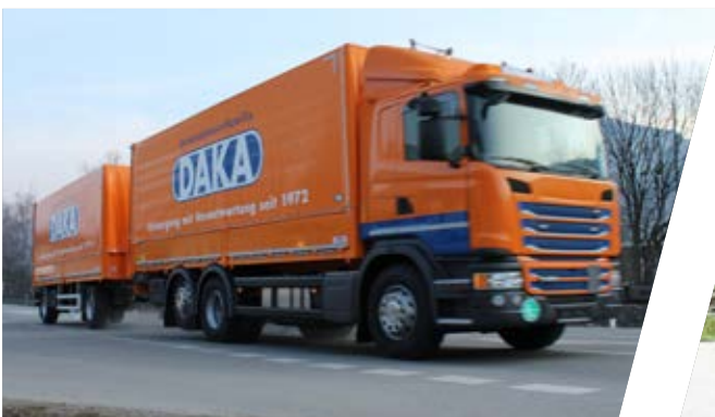
Pritschen/Planenaufbau mit Anhänger