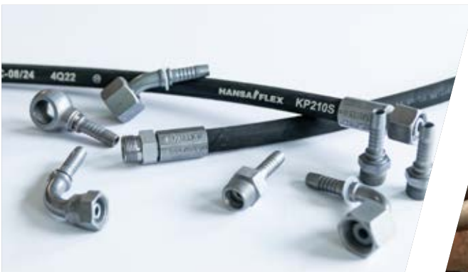
Passende Systemkomponenten auf Lager

Gemäß Hersteller bzw. gesetzlicher Empfehlungen sollten die Schläuche nach 6, spätestens 8 Jahren getauscht werden. Besuchen Sie eine unserer Werkstätten. Wir beraten und unterstützen Sie gerne.