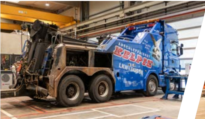
BISON Bergefahrzeug: Instandsetzung eines Unfallschadens

Egal ob Baubranche, Abschleppdienst, Lebensmitteltransport oder Holz- & Abfallwirtschaft, unsere Teams in Kaltenbach und Hall orientieren sich an Ihren Wünschen und Anforderungen und meistern gemeinsam mit Ihnen die täglichen Herausforderungen. Profitieren Sie von unserem umfassenden Komplettservice für Ihre Nutzfahrzeuge.