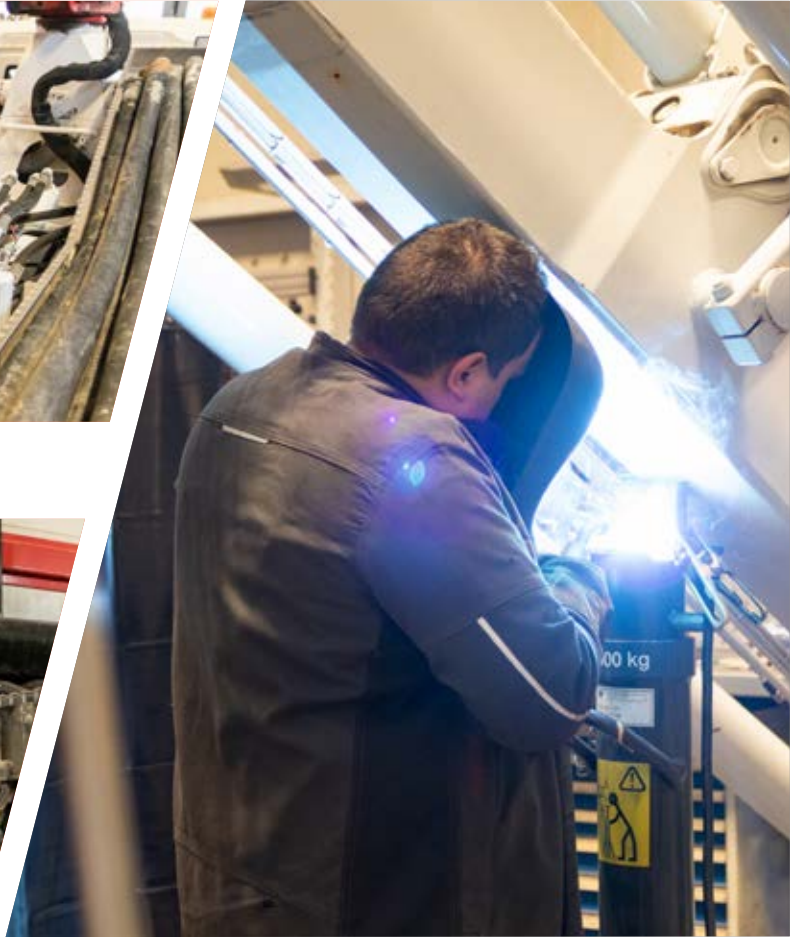
Schweißarbeiten am Mast einer Betonpumpe