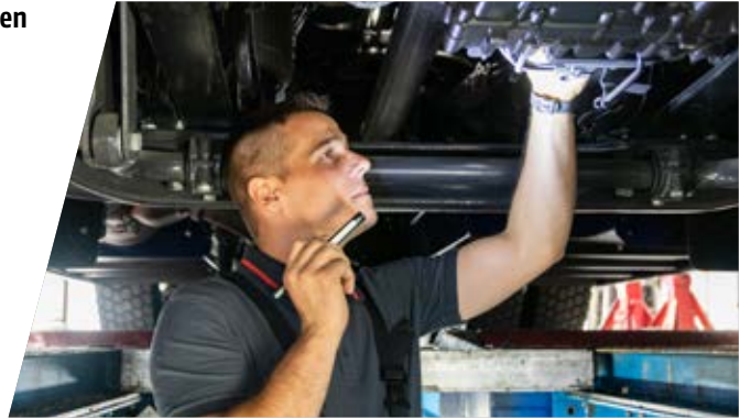
§57a Überprüfungen „Pickerl“