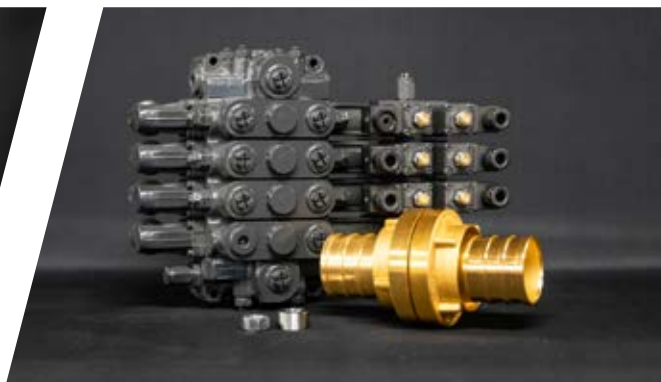
Jedes Teil zum richtigen Zeitpunkt