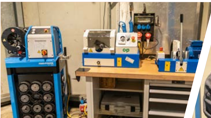
Modernste Maschinen zur Schlauchfertigung