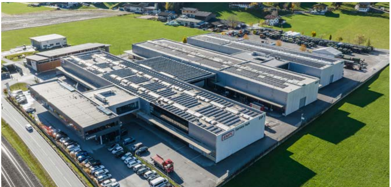
Servicestandort Zillertal: EMPL Service Park – ESP, Kaltenbacher Landstraße 42, 6272 Kaltenbach