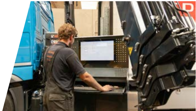
Modernste Möglichkeiten zum Auslesen von Ladekränen