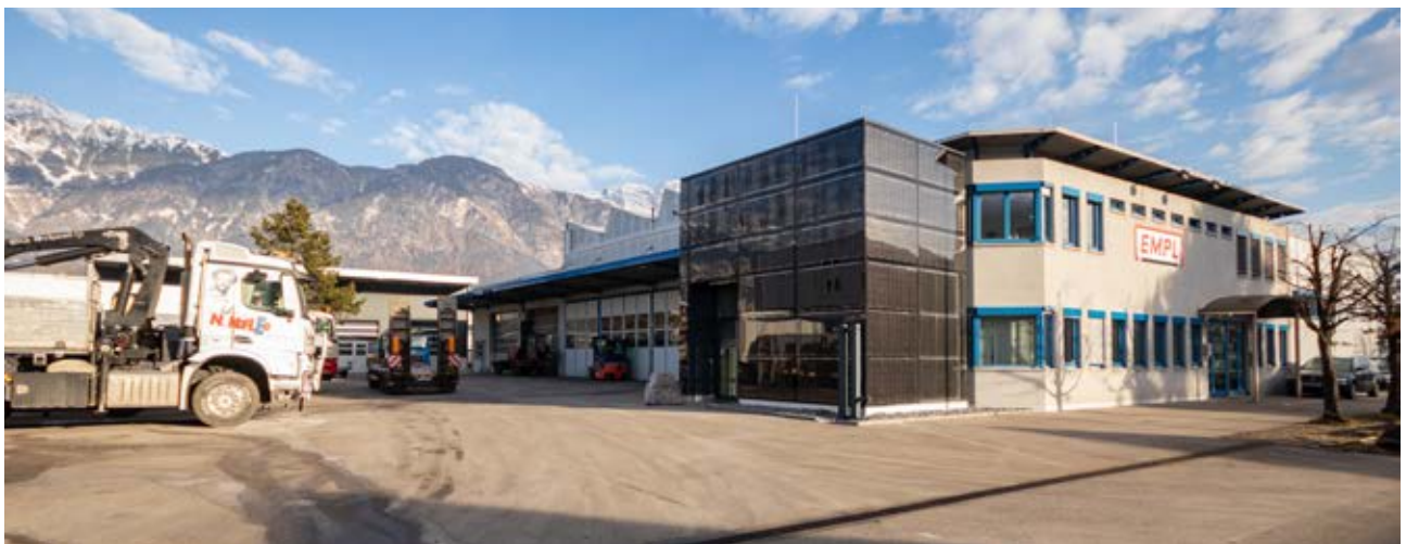
Servicestandort Inntal: EMPL Servicewerk Hall, Schlöglstraße 20, 6060 Hall in Tirol