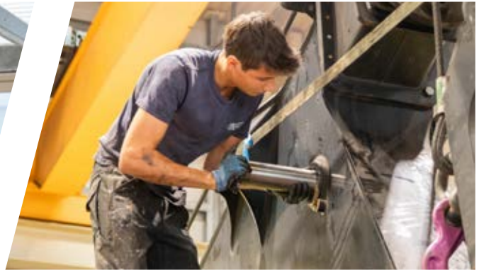
Tausch von defektem Bolzen