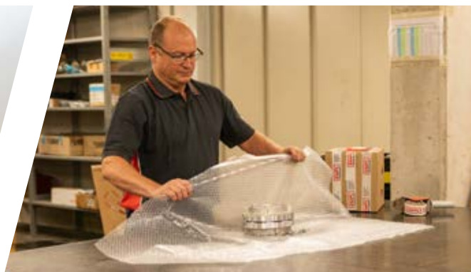
Motiviertes Team und effizientes Lagermanagement