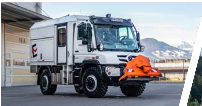
Mannschaftstransport / Werkstatt-/ Serviceaufbau