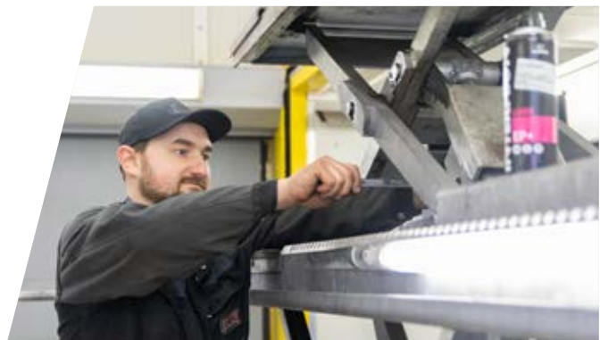
Mängelbehebung nach Überprüfung