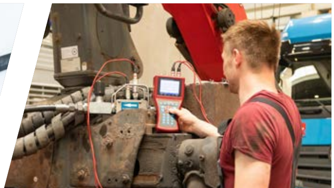
Durchflussmengenmessung an einem hydraulischen System